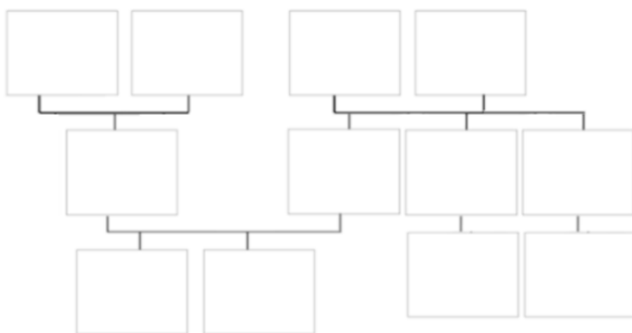
Схема для заполнения